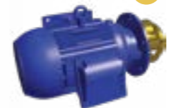
Орошающий насос без улитки