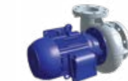
Орошающий насос с улиткой